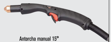
Antorcha manual 15°