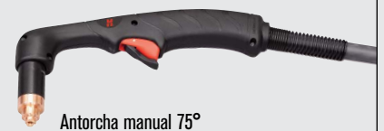
Antorcha manual 75°

(visitar www.hypertherm.com para más opciones de antorchas)