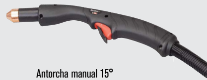
Antorcha manual 15°