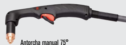
Antorcha manual 75°

(visitar www.hypertherm.com para más opciones de antorchas)